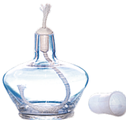
Palnik spirytusowy M

Palnik szklany spirytusowy z kotpakiem polipropylenowym.