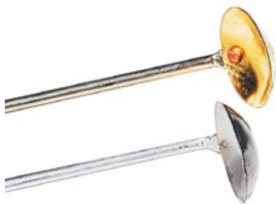
Łyżeczka do spalań z mosiądzu łyżeczka do spalań z mosiądzu.

710542 16,90 zł Wymiary: dł.: 35 cm, śr.: 1,8 cm