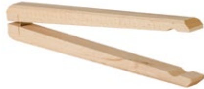
Łapa uniwersalna do kolb Do kolb i probówek.