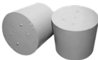
Korek gumowy, bez otworów