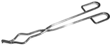
Uchwyt do tygli Szczypce do tygli ze stali chromowanej.