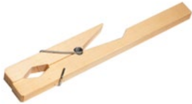
Łapa do probówek Uchwyt do probówek – drewniany.